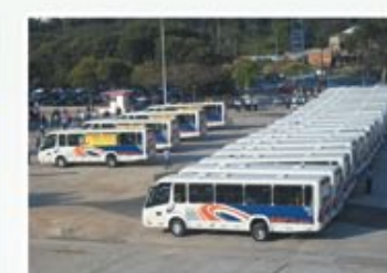
Apresentação dos 62 micro-ônibus