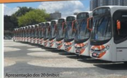
Apresentação dos 20 ônibus