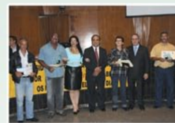
Homenagem aos motoristas na Câmara