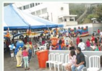
Festa do Dia das Crianças