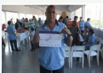
Café com a Diretoria - 25 de maio