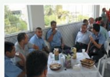
Café com a Diretoria - 8 de julho