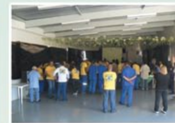
Copa do Mundo