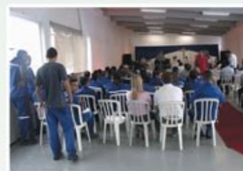
Culto Ecumênico - 22 de dezembro