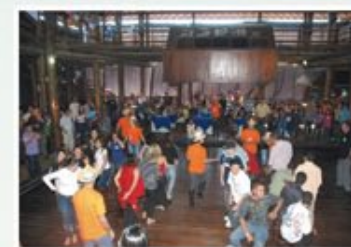
Festa do Dia do Motorista