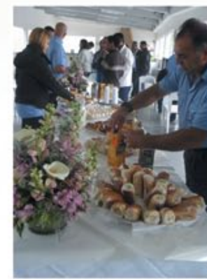
Café com a Diretoria 5 de outubro