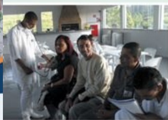
Dia Mundial da Saúde