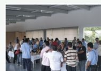
Café com a diretoria - 7 de dezembro