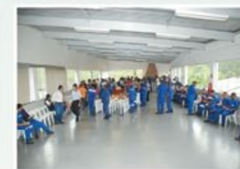
Café de Natal