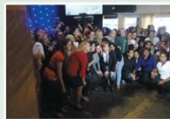
Dia da Secretária