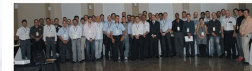
2º Fórum sobre Pneus