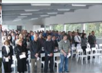
Culto Ecumênico-28 de maio