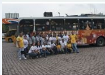
Natal da Solidariedade